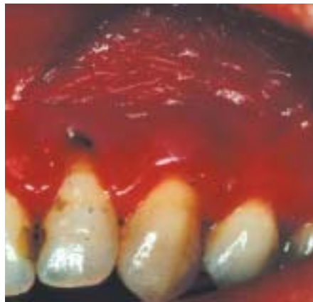
Långvarigt snusbruk till vänster i överkäken. Slemhinnan är kraftigt förtjockad och veckad. Här ses en tillbakadragning av tandköttet på en av framtänderna plus en missfärgning av tänderna.

ning. Såväl teoretiska som kliniska cancerforskare har opponerat sig, då snus har visat sig vara mer cancerframkallande än man tidigare har vetat om eller publicerat. I bukspottkörteln ökade cancerrisken med 87 procent enl. IARC. I en norsk studie av denna sjukdom befanns en tredjedel vara snusare. Ytterligare tre studier