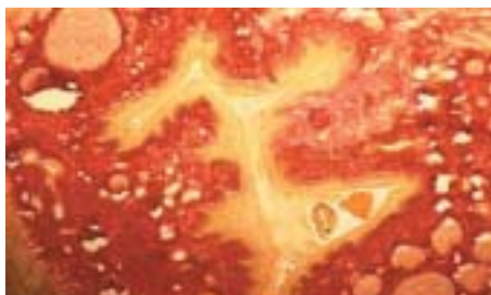
På denna bild ses av snus framkal- lade förändring av munslemhinnan i mikroskop. I mitten ses ett veckat gult parti som visar en ordentlig förhornning av ytan, en förtjockning av slemhinnans översta cellager och kolvar av celler som växer ner i den underliggande bindväven som ses brunröd på bilden.