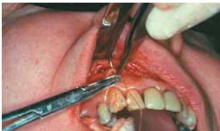
Här har tagits ett vävnadsprov av slemhinnan i överkä- ken för att kunna se i mikroskop omfattningen av för- ändringarna som snusandet åstadkommit. Nu sätts några suturer efter provtagningen.