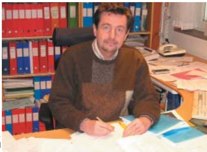
Göran Pershagen, professor och chef för IMM

- Vi räknar med att man kan tillskriva radonet ca 400 fall av lungcancer per år av de ca 2500 fall vi nu har i landet. Men de allra flesta av dessa 400 är samtidigt rökare. Det finns ett starkt epidemiologiskt stöd för att radon verkligen innebär en riskökning för lungcancer. Vi sammanställde resultat från 13 olika studier i Europa. De omfattade 7000 lungcancerfall och 14000 kontroller, och man mätte radonhalten i deras bostäder. Men när