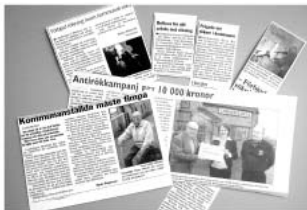
Klipp från lokala tidningar i Blekinge 2005.