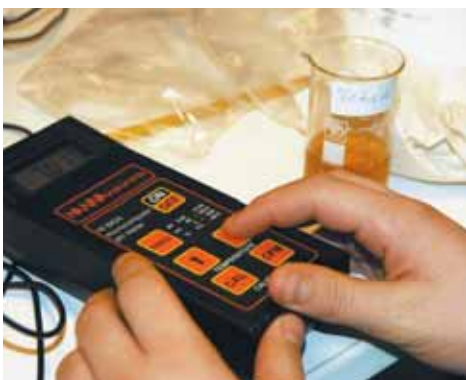
Tobaksprovet under test.