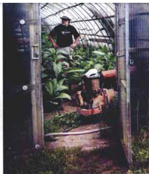
Två män. En tobaksskörd. Och om några månader exklusiva cigarrer. Kuba? Nej, Blekinge. Text: Johannes Cleris