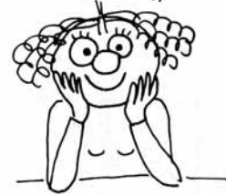
Ur Lilla Fruntimmers boken med tillstånd av Gunilla Dahlgren

Det är dumt att röka, när det finns så mycket annat dumt man kan göra, som inte är så dumt.