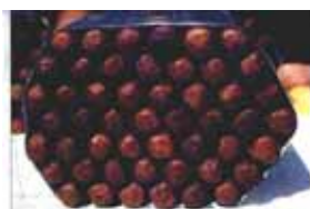
Åhus cigarrer av märket Åhus-Hästens nära Sjölands skörd.